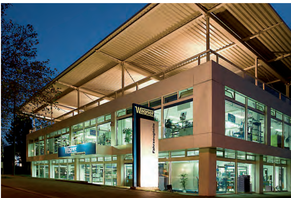
Halle Süd der Wagner GmbH & Co. KG

„Dank der Archivanbindung an Varial haben wir einen schnellen Datenzugriff und eine hohe Datentransparenz erzielt.“