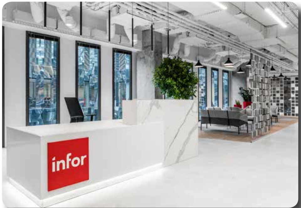
Infor Entwicklungszentrum in Breslau

Bereits Ende 2018 wird es schon einen kleinen Vorgeschmack geben: Dann wird der Mitarbeiter Self Service in der neuen Technologie veröffentlicht! Die Freigabe des neuen Finanzwesens ist für das zweite Halbjahr 2020 geplant. Das neue Personalwesen wird voraussichtlich Ende 2021 freigegeben werden.